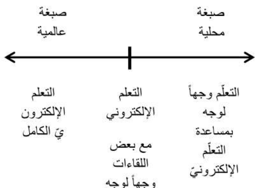
شكل (1): المقياس المتصل لتطبيق التعلم الإلكتروني

وتستخدم التكنولوجيا من أجل ملء الفجوة بين الطرفين، ومحاكاة للاتصال الذي يحدث وجهاً لوجه.